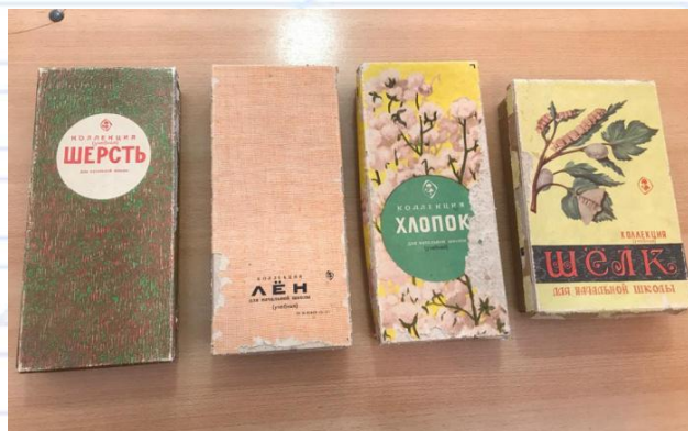
Наглядные пособия по материаловедению