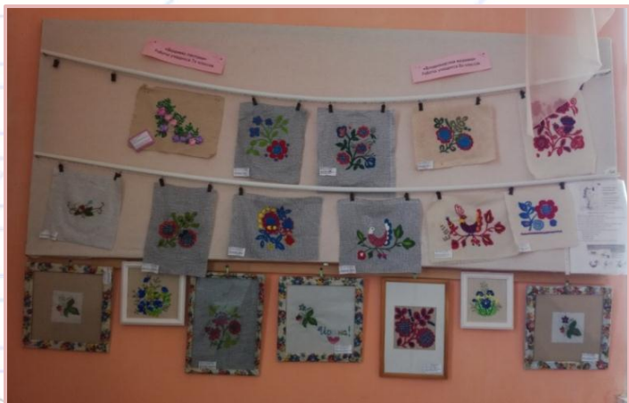
Для выставочных работ (регулярно обновляются)