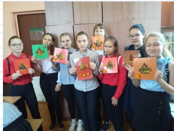
Изготовление подарков к дню матери, 8 Марта и Дню пожилого человека