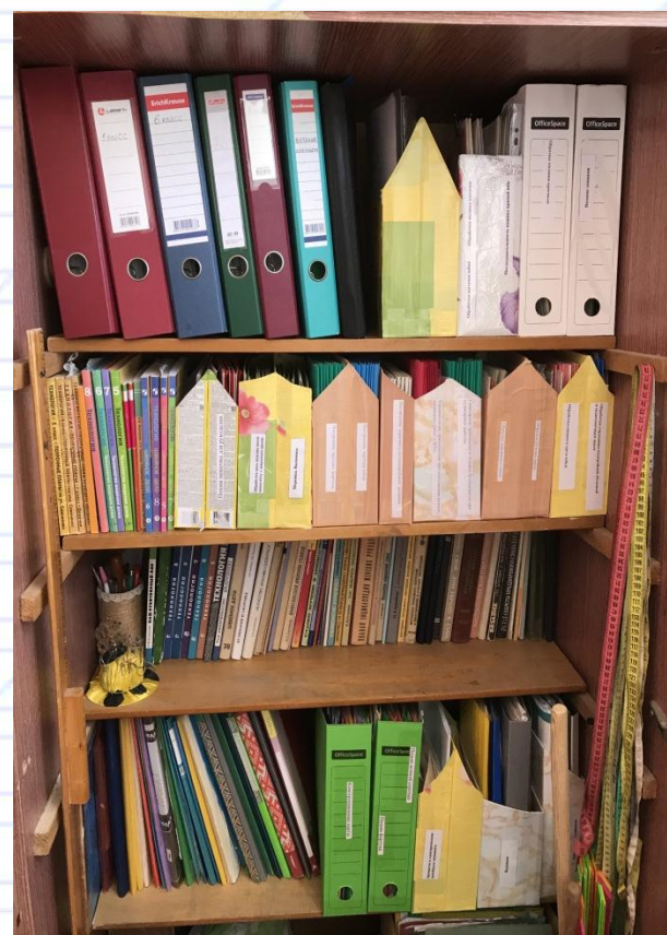
Раздаточные материалы, наглядные пособия, учебная литература