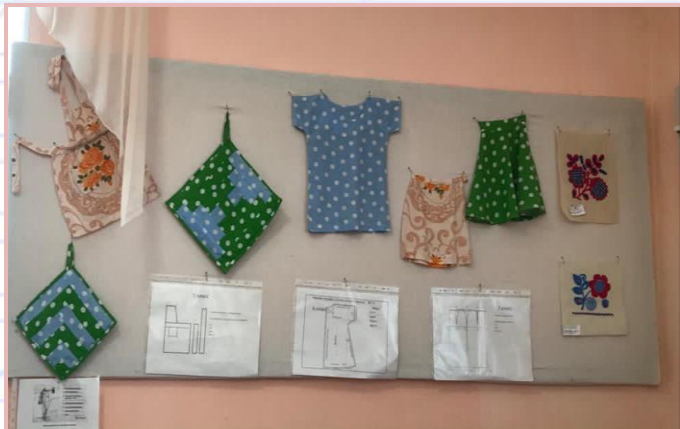
Образцы планируемых работ по классам