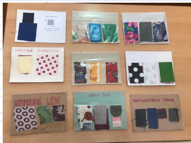
Образцы тканей для уроков материаловедения

Плакаты по темам урока пронумерованы и расположены согласно списку, который висит на стене, что позволяет быстро найти нужный.