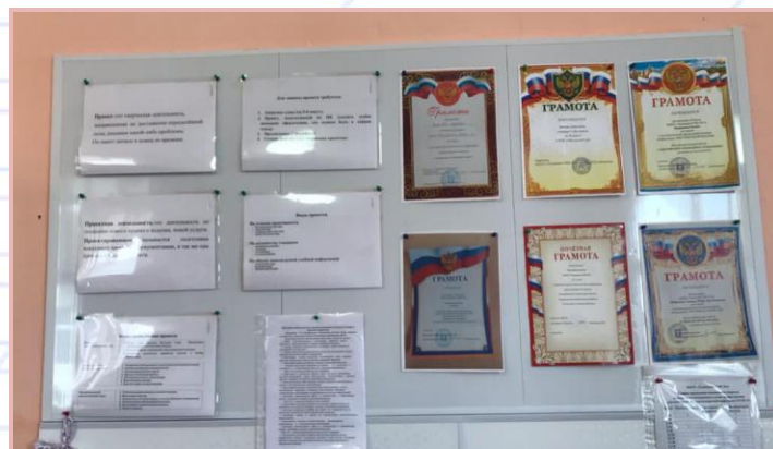
Проектная деятельность и достижения обучающихся