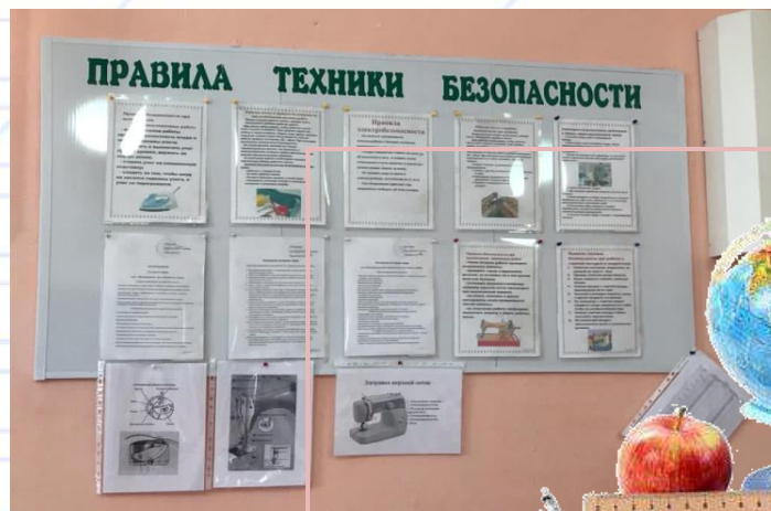
По технике безопасности