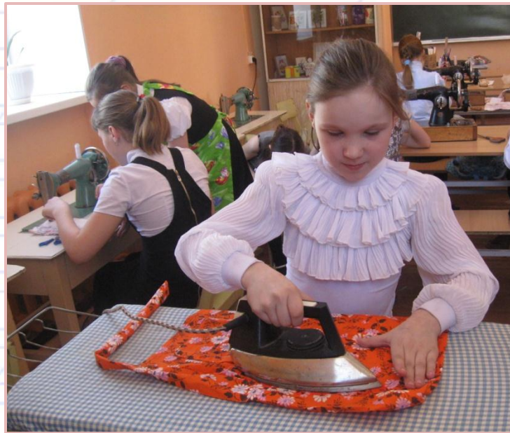
Гладильная доска и утюг