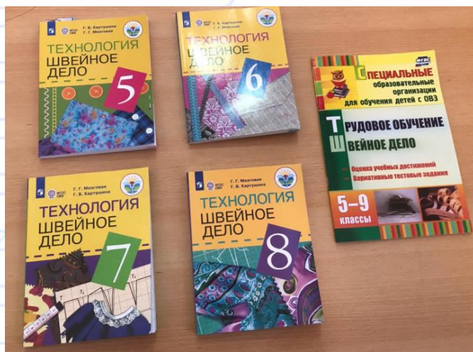
Учебники и контрольно-измерительные материалы