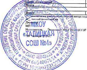
Раздел 3. Итоговые показатели бюджетной сметы