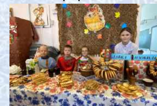
Подворье 5 «А» класса