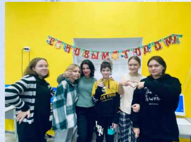
Участники школьной МедиСтудии «Атмосфера»