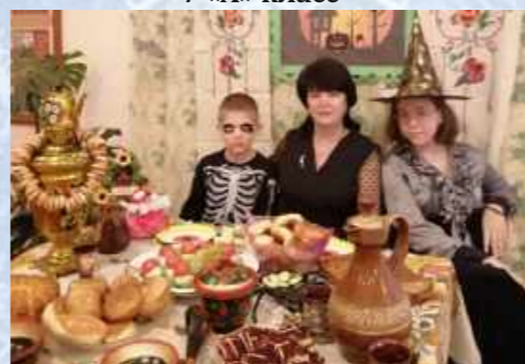
Подворье «Русской нечисти» 8 «А» класс