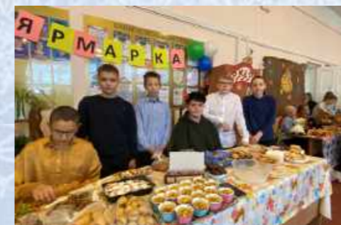
Участники «Осенней ярмарки» 7 «А» класс