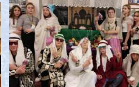
Команда «Восточные сказки» 9 «А» класс