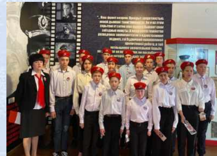
Фото юнармейского отряда «Сокол» после принятия присяги

В настоящее время во всех 85 субъектах России действуют региональные отделения Всероссийского военно-патриотического общественного движения «ЮНАРМИЯ». В его ряды вступили более 300 тысяч школьников.