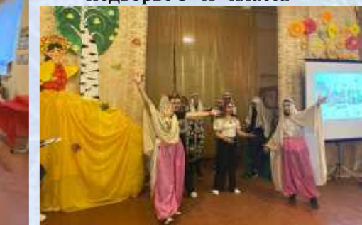
Творческий номер 9 «А» класса