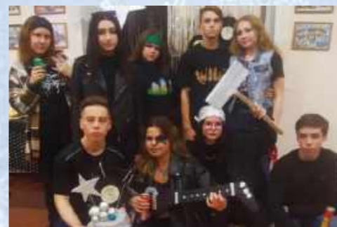
Команда «Рокеры» 10 класс

Этот праздничный день в школе был самым настоящим пиршеством для ребят! Море угощений, музыка, песни и танцы - надолго оставят у всех яркие осенние воспоминания.