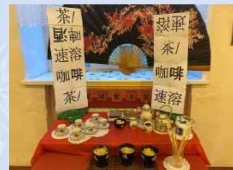
Кафе команды «Васаби» 9 «В»